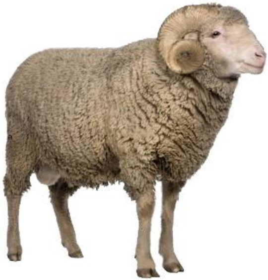
B E R B E C