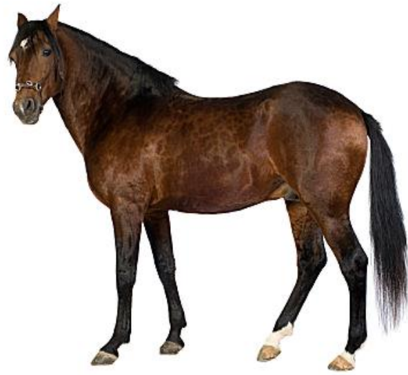
C A L