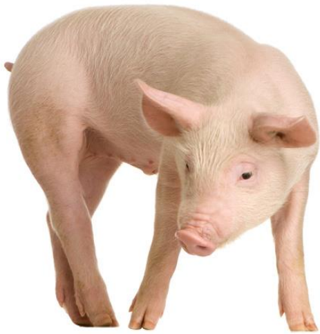
P O R C