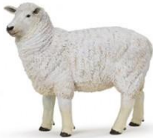
O A I E